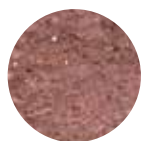
Chocolate (Sobre pedido)